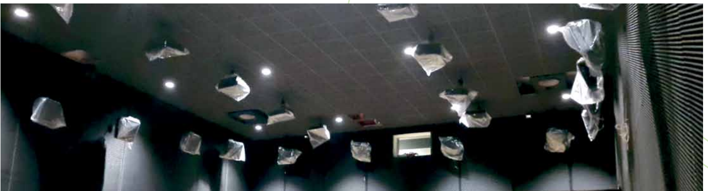
» Her vises et udsnit af højttalerne i en af de mindste sale og desuden kan anes begge subwoofere, der er monteret i loftet over bagerste række.

Allerede ved indgangen mødes biografgængerne af inspirerende og informative levende plakater i