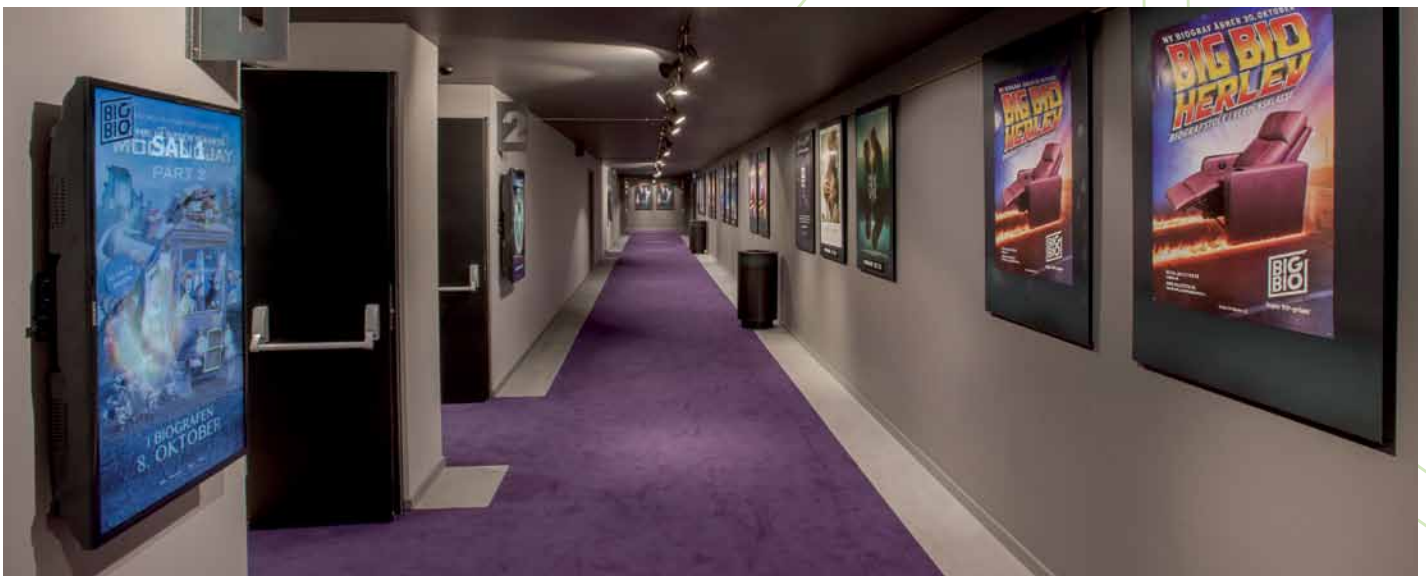
☑☑☑ Skærmene uden for de enkelte sale afvikles også fra AVCs DisplaySystem.

Der kan ikke herske tvivl om at BIG BIO går all in og at gæsterne garanteres en helt suveræn luksuriøs oplevelse!