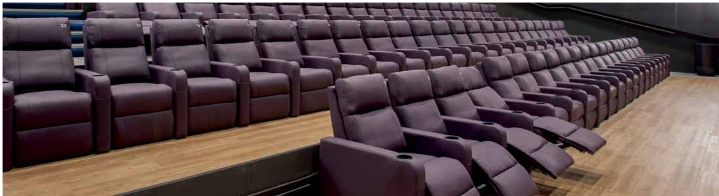
🌱 De luksuriøse lænestole er større og dybere end standard-biografstole og de har individuel elektronisk styring så den enkelte gæst kan sidde præcist som ønsket.

I alt er der plads til 551 personer i de 5 sale, hvilket jo i sig selv ikke lyder af meget. I en traditionel biograf af samme størrelse vil der normalt være over 1000 pladser i alt, men volumen er slet ikke det bærende element i tanken bag BIG BIO. Der er tænkt luksus og komfort ind i hver eneste de-