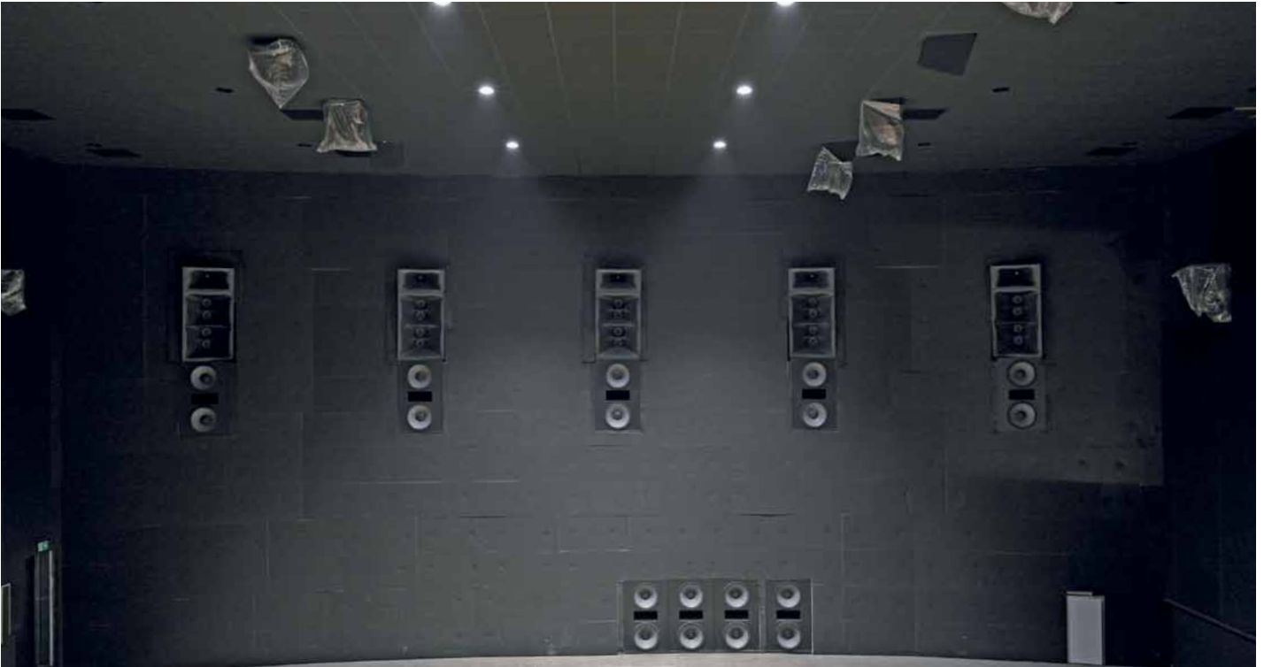
» På bagvæggen i den største sal er der bag lærredet monteret fronthøjttalere, centerhøjttaler og subwoofere.

talje og der brydes med alle tidligere opfattelser af en tur i biografen.