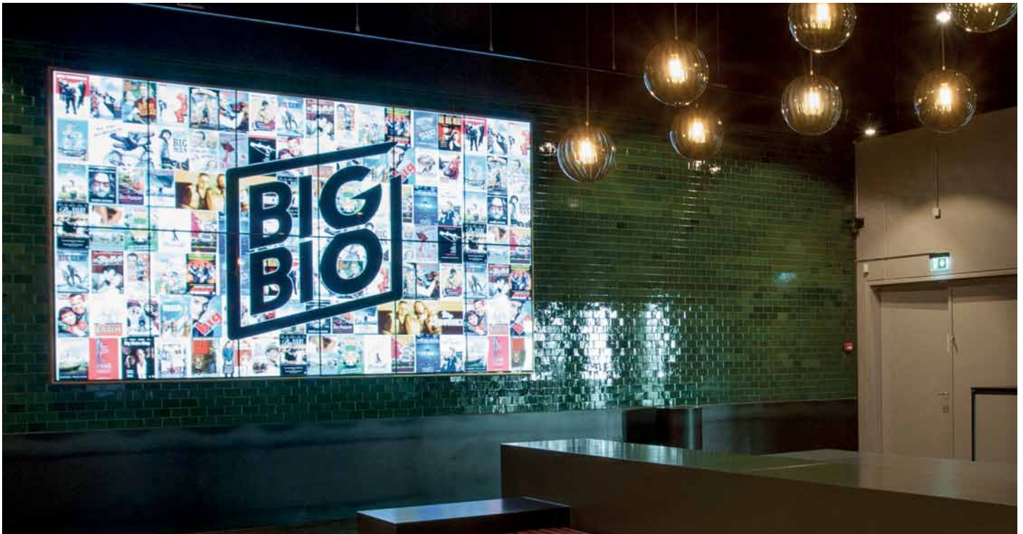
☑☑☑ I lounge-området findes den store skærmvæg med i alt 12 skærme, som med trailers fra kommende film giver biografgængerne en knivskarp oplevelse af hvad de har i vente.

form af digitale skilte, der følger dem på deres færd gennem hele biografen og bibringer en anderledes og unik stemning.